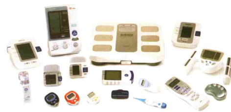
Merilniki krvnega tlaka • Termometri • Inhalatorji Merilniki telesne sestave • Elektro stimulatorji • Števcii korakov